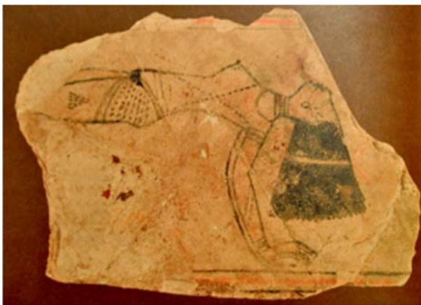
Ostraca de l'Égypte antique (tesson de poterie support d'écriture)