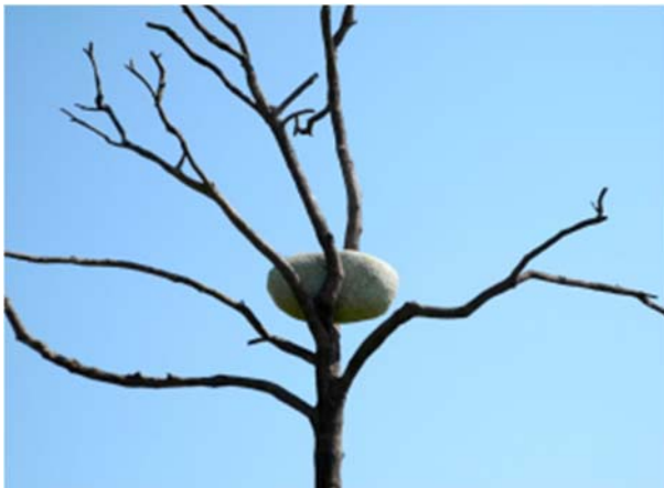
Œuvre de Giuseppe Penone (né en 1945)

« Les pierres à images et pierres à imaginer », de même que les processus et procédés que leur élaboration demandent, répondent ainsi, d'une part, à une précédente invitation « Matière(s) à penser » et, d'autre part, à une préoccupation constante associant l'étude de « quelque chose de l'art » qui conduit à se former, à une démarche créative.