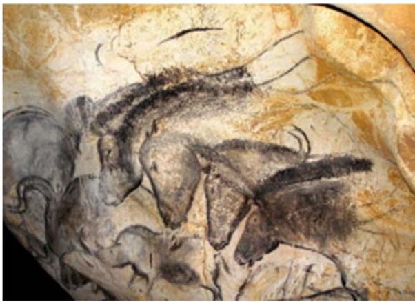
Grotte Chauvet, France. Visite virtuelle.