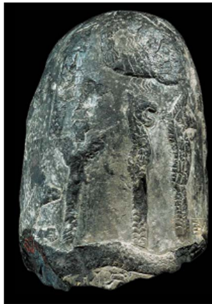
Sommet d'un kudurrû portant des symboles divins inscrits Suse, fin du IIe millénaire av. J.-C.