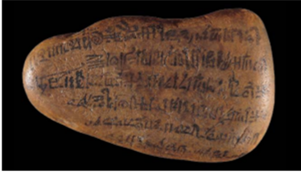
Compte rendu d'un acte officiel Haute-Égypte, Nouvel Empire, XIX dynastie, règne de Ramsès II, 1226 av. J.-C.